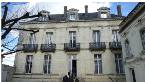
« River House »