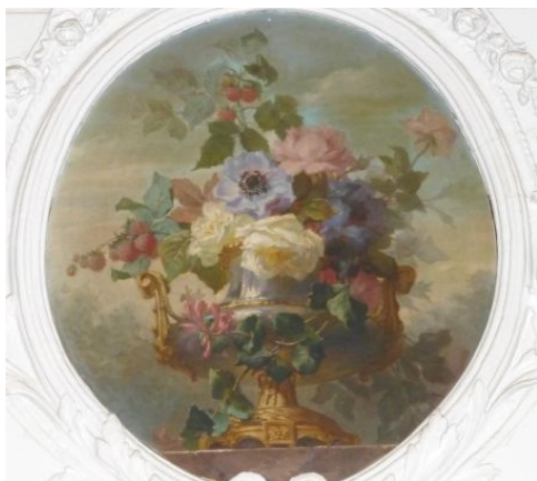
Magnifique peinture au dessus d'une porte intérieure