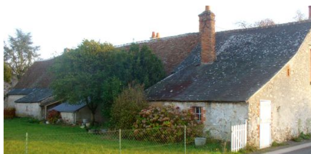
Façade nord et dépendances

A noter ! C'est au nord de cette maison que sera organisé le stage de montage de mur Maisons Paysannes les 1 er et 2 juin prochains au 25 rue du Chanoine Noël Carlotti à Esvres sur Indre (37320).