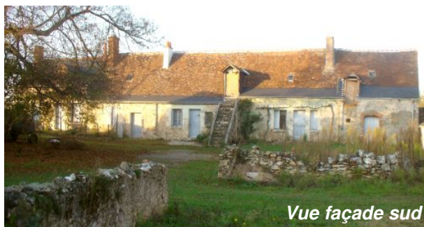
Vue façade sud