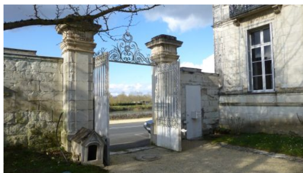
Le portail et la niche en pierre de taille

PS :Pardonnez moi de m'être étendu sur ce sujet mais ce n'est pas tous les jours que l'on peut relier une maison tourangelle à un président de la République, de surcroît un modèle de promotion républicaine. C'est le seul ex-ouvrier à l'Élysée, un fils du peuple, le 7 e président de la République Française.