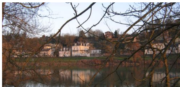
La maison vue de la Loire