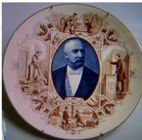
Assiette à l'effigie de Félix Faure

à cause de ses pieds propres, jusqu'au président originaire de Dieppe amateur de morue et les faisant dessaler dans les chasses d'eau des toilettes de l'Élysée, etc.