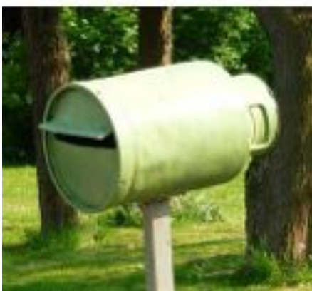
Faite avec un objet détourné, ici un pot à lait

Pour ceux qui n'ont pas la fibre artistique il existe des auto-collants, cela n'a pas le même charme que la peinture (En tapant stickers boîtes à lettres sur Internet, on trouve aisément ces produits, il faut compter environ 15 €/par sticker)