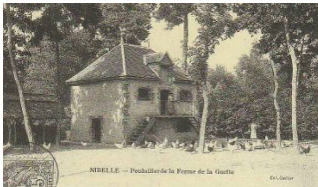
Carte postale d'un poulailler dans le Loiret (une maison pour les poules)