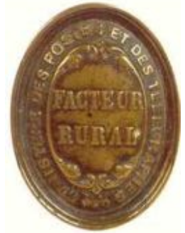
Plaque de facteur

En 1889, le sous-secrétaire d'État aux Postes et Télégraphes, Léon Mougeot, met en service un nouveau modèle de boîtes aux lettres, rapidement appelées « Mougeotte ». La plupart des anciennes boîtes aux lettres étaient vétustes, L. Mougeot a donc voulu les remplacer et a fait appel au fondeur parisien Delachanal qui a proposé un modèle en fonte. Elle est dotée de trois petites fenêtres permettant de voir si la dernière levée a été faite. Le coloris des boîtes aux lettres était défini par région. Pour financer ces investissements on institua une taxe forfaitaire d'un décime en plus de la taxe progressive à la charge du destinataire. Il faudra attendre 1849 pour voir la création du premier timbre (cérès à 20 cts) cette fois ci à la charge de l'expéditeur.