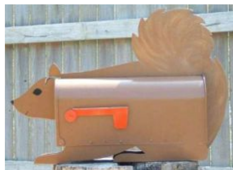
Transformée en écureuil