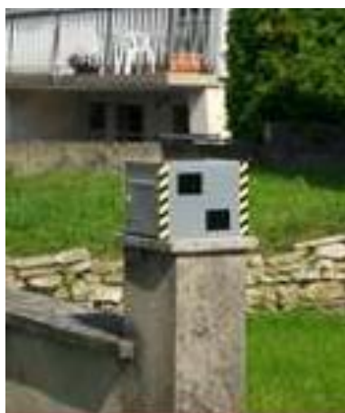
Attention au radar ! Pas sûr que cela fasse ralentir les fous du volant