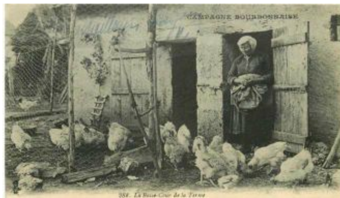
Carte postale d'un poulailler de ferme dans l'Allier