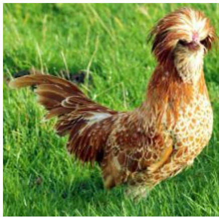
Petite padoue ( rigolote, non ? )