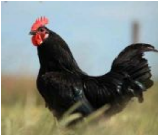
Géline de Touraine