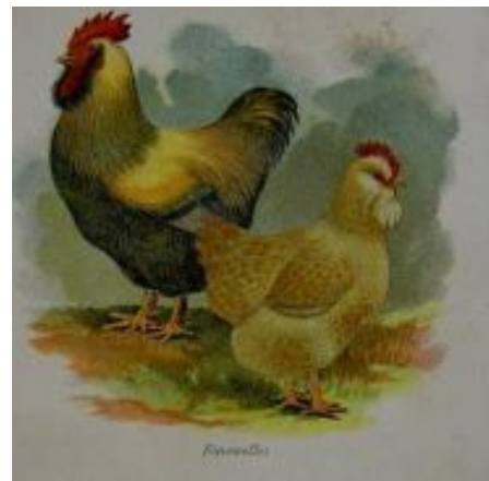
Faverolles, la poule beauceronne à 5 doigts