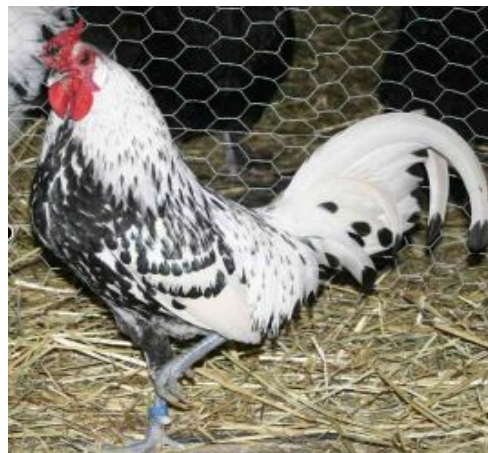
Hambourg argenté pailleté