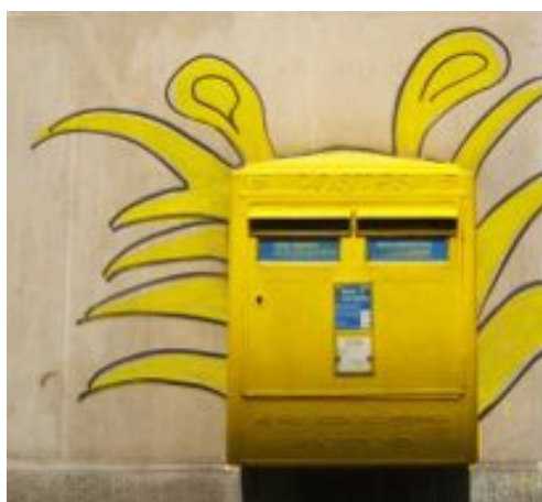
Avec un arrière-plan dessiné. Laisser parler votre imagination !