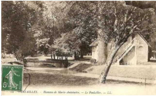
Carte postale du poulailler royal du hameau de la Reine Marie-Antoinette