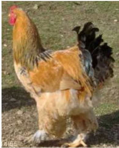
Brahama fauve hermine