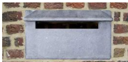
Deux belles entrées de boîtes à lettres, en fonte et en pierre bleue (Belgique) Discrètes pour les murs et les portails mais problématique pour les colis