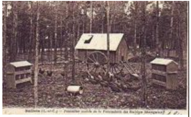
Carte postale d'un poulailler ambulante dans le Loir et Cher