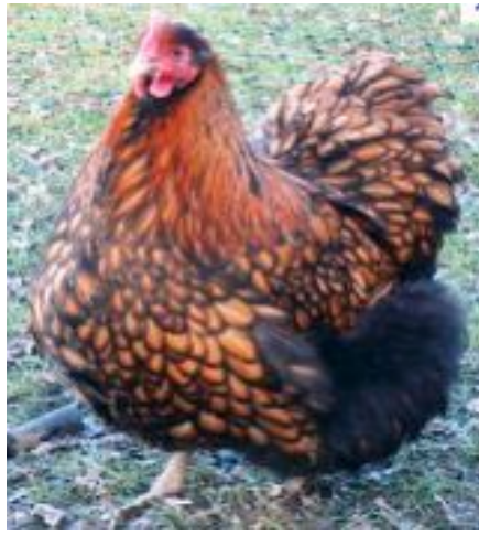
Orpington fauve à liseré noir, la poule « nounours »