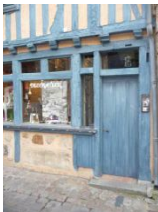
Le vieux Mans. Harmonieux. Petite porte en bois de la même couleur cachant le coffret EDF. (En bas à gauche de la porte)

Dans le même genre, on ne peut que regretter de voir partout les mêmes coffrets EDF en plastique et qui vieillissent mal. Pourtant avec un peu d'imagination on peut les cacher habilement avec une porte en bois de la même tonalité que les huisseries. Ainsi dans le vieux Mans on peut observer quelques magasins avec des coffrets bien dissimulés à l'abri des ultra-violets. La beauté d'une maison va jusqu'aux détails.