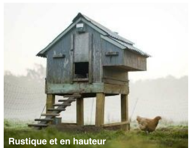
Rustique et en hauteur