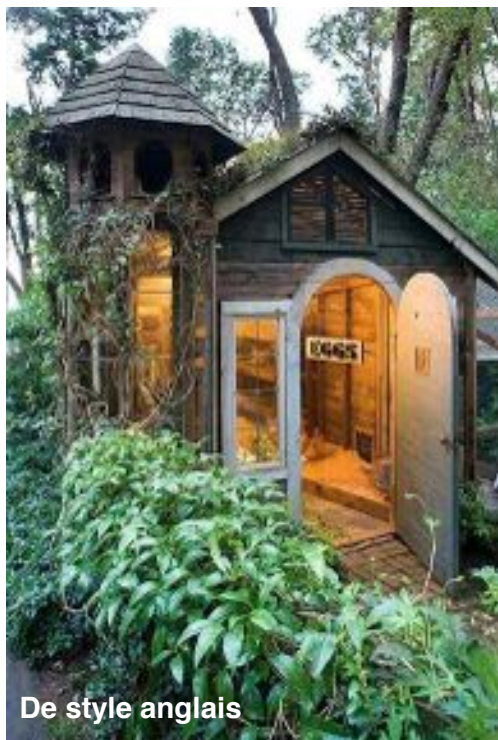
De style anglais

Voici quelques jolis modèles pour vous inspirer