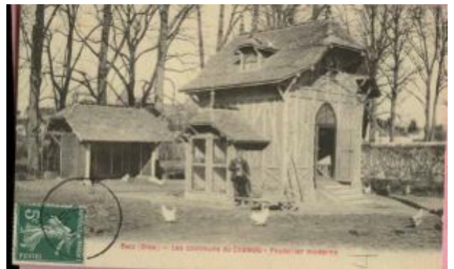
Carte postale d'un poulailler moderne dans l'Oise