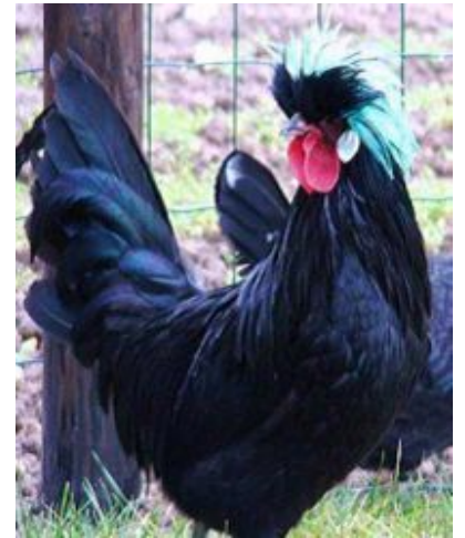
Hollandaise noir huppé