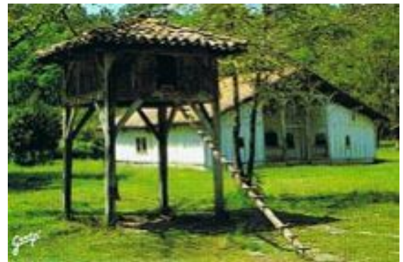
Un poulailler landais, haut perché pour éviter les renards