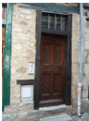
Le vieux Mans, coffret EDF trop visible. Pas terrible !

« La beauté n'est pas une idée absolue et ne peut s'apprécier que par le contraste », Théophile Gautier