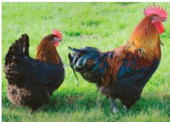
Marans noir cuivré « la poule aux œufs d'or couleur chocolat »