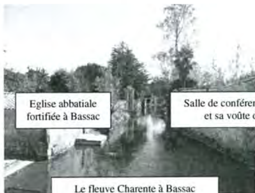
Eglise abbatiale fortifiée à Bassac