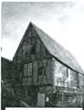
Réfection du colombage en cours de réalisation

Dans ce contexte, l'activité de Maisons Paysannes de Touraine ne se relâchera pas. Nous esquissons dans ce bulletin le programme qui sera proposé aux adhérents lors de leur assemblée générale annuelle du 16 février 2008 . Le bulletin de Mars 2008 qui rendra compte des délibérations et votes de cette assemblée précisera les conditions de participation individuelle pour l'ensemble des activités. Le présent bulletin se limite à ouvrir les inscriptions pour les activités de printemps antérieures à la parution du prochain. Pour poursuivre une telle activité nous avons naturellement besoin de toutes les bonnes volontés. Une nouvelle candidature pour rejoindre notre équipe de bénévoles s'est déclarée. Nous serions confortés si de nouvelles demandes étaient exprimées d'ici ou au cours de l'assemblée générale. Nous serions tout à fait satisfaits de voir s'améliorer notre ratio Hommes/Femmes. C'est simple et gratifiant de participer juste dans les limites de sa propre disponibilité.