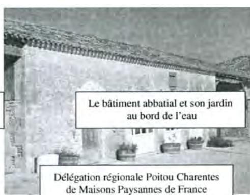
Le bâtiment abbatial et son jardin au bord de l'eau