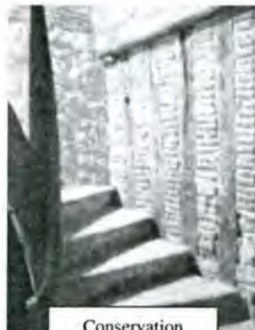
Conservation de l'escalier intérieur