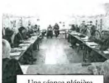
Une séance plénière