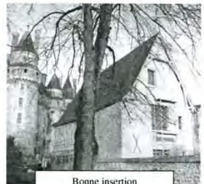
Bonne insertion dans l'environnement