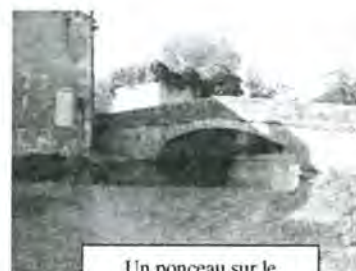
Un ponceau sur le fleuve, à Bassac