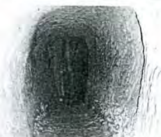
Aperçu de la galerie du souterrain refuge - 6 mètres de dénivelé aboutissant à une salle circulaire.