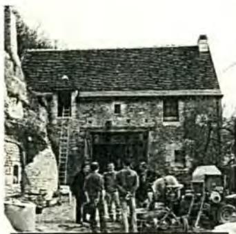
Stage chaux et chanvre 15 mars Villaines-les-Rochers