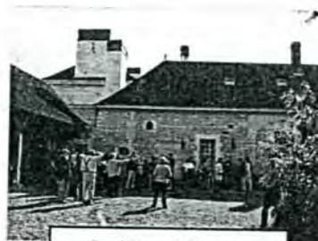
Pavillon côté bourg. Petite baie en bas du mur à gauche : la boulangère.