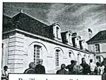
Pavillon de nos adhérents Joubert côté cour du château