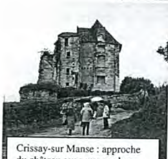
Crissay-sur Manse : approche du château avec vue sur les cheminées intérieures de la partie effondrée du donjon