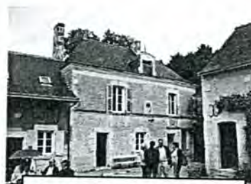
Le président Côme décrivant ce bel ensemble de bâtiments anciens bien entretenus.