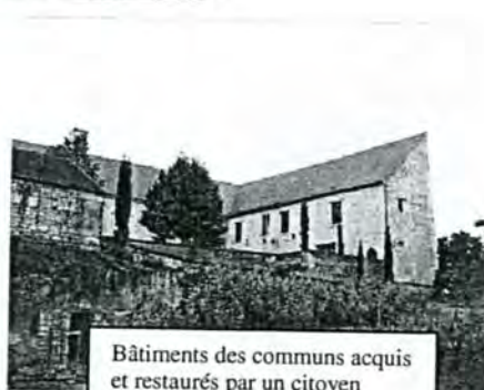
Bâtiments des communs acquis et restaurés par un citoyen américain d'origine coréenne