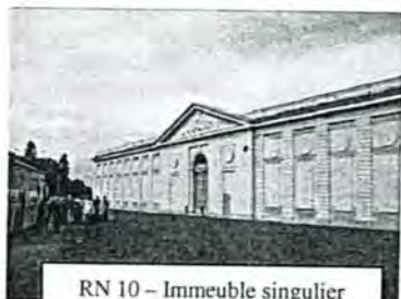
RN 10 – Immeuble singulier construit pour servir de noble vis-à-vis au château