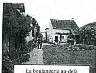
La boulangerie au-delà d'une pelouse avec petit potager. Inattendu. Bel effet.