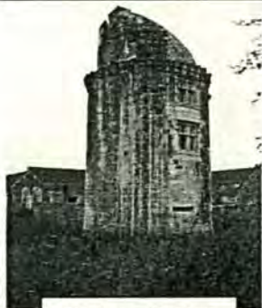
Donjon restauré vu côté extérieur