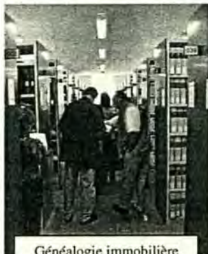
Généalogie immobilière 24 avril Chambray-lès-Tours