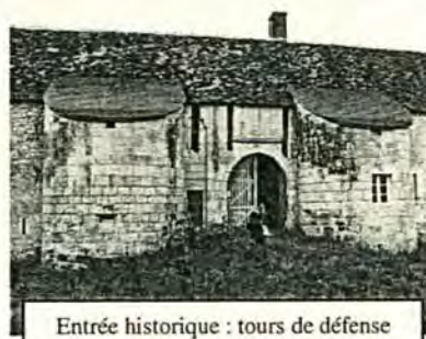
Entrée historique : tours de défense et jours du passage des potences des ponts-levis, charretier et piétonnier