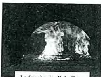
Le four à pain. Bel effet de flammes également avec u fagot de sarments.