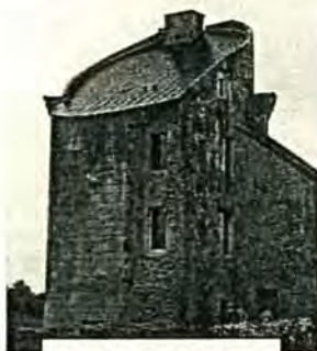
Donjon restauré vu côté cour de ferme