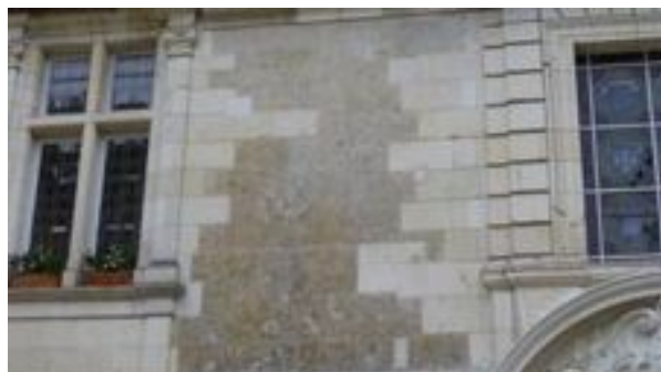
Enduit en fausse coupe de pierre au château de Noizay