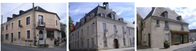
L'hôtel-restaurant des Voyageurs à Château-la-Vallière, la mairie de Richelieu, le commerce et l'habitation à Sainte-Maure-de-Touraine

Une devinette pour commencer. Quel est le point commun entre ces trois bâtiments ?