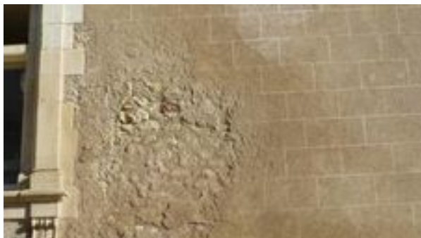
Enduit en fausse coupe d'appareillage

C'est une technique qui consiste à faire un enduit sur un mur en moellon en faisant une fausse coupe de pierre appareillée. Nous pouvons en observer assez souvent principalement sur des façades de châteaux ou de maisons bourgeoises. Cette mode que je croyais fin 19e et début 20e siècle est en réalité beaucoup plus ancienne (XVIIe siècle). Depuis je regarde plus attentivement ces enduits comme ceux que j'ai vu récemment au Château de Noizay.