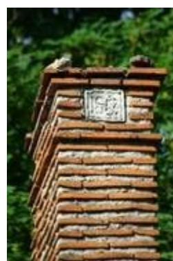
chez un adhérent à Saint-Branches. C'est rare de voir une cheminée en brique ainsi datée de 1853 dans une petite pierre.

A remarquer aussi le couronnement qui peut servir comme exemple à des restaurations de