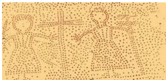
Enduit aux clous : un motif religieux

* Les clous pouvaient être aussi des pointes en bois, peut-être plus faciles à façonner et donc plus facile pour créer des motifs (cœur, rosace, etc.)