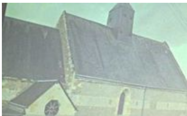
Bandeau extérieur sur l'église de Vouvray-sur-Loir

Du latin lista 1 qui signifie bordure. C'est une décoration faite à l'occasion des funérailles d'une personnalité qui consistait à badigeonner un bandeau noir 2 pouvant faire le tour de l'édifice religieux soit à l'intérieur ou à l'extérieur avec les représentations de ses fonctions et de ses armoiries. Ces ceintures seigneuriales apparues à la fin du Moyen-Age ont été effacées par les intempéries à l'extérieur des églises ou bien recouvertes par des couches successives de badigeon à l'intérieur des sanctuaires. Le conférencier nous a montré un bandeau très visible à l'extérieur de l'église de Vouvray-sur-Loir. 3