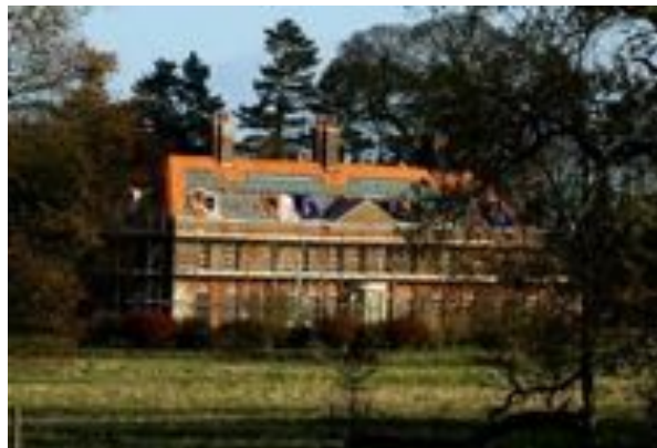
Anmer Hall dans les environs de Sandringham (Norfolk) avec ses nouvelles tuiles