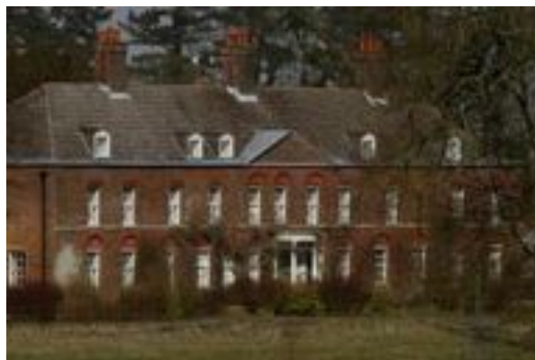
Anmer Hall dans les environs de Sandringham (Norfolk) avant les travaux

Du coup nous avons une hésitation pour notre projet de sortie Maisons Paysannes à l'étranger: Italie, Angleterre ou Ecosse ? Ceux qui veulent nous aider à trouver des endroits très Maisons Paysannes pour ce projet de sortie sont les bienvenus en me contactant sur mon portable 06.30.20.25.30 ou par mail : francoiscome37@orange.fr Nous cherchons un responsable pour mener à bien ce projet de sortie à l'étranger.