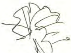
Brycei X Polo que d'Al nol XIXe siècle