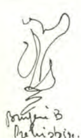
Brycei B Preliminary