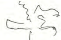
Brycei chose quelle - niché Norwegian